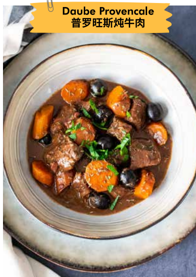
Daube Provencale 普罗旺斯炖牛肉