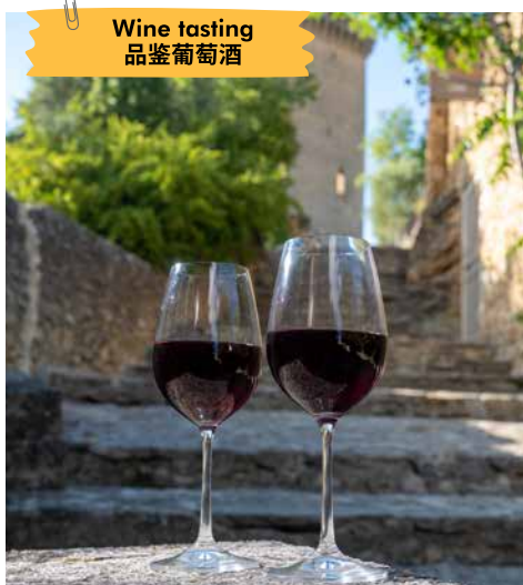
Wine tasting 品鉴葡萄酒