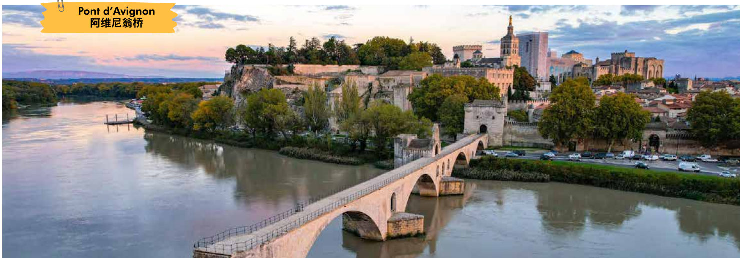
Pont d'Avignon 阿维尼翁桥