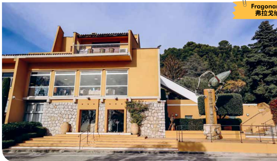
Fragonard Parfumeur 弗拉戈纳尔香水工厂