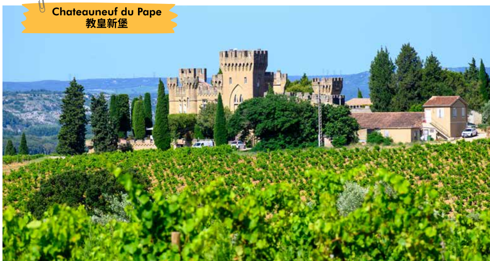
Chateauneuf du Pape 教皇新堡