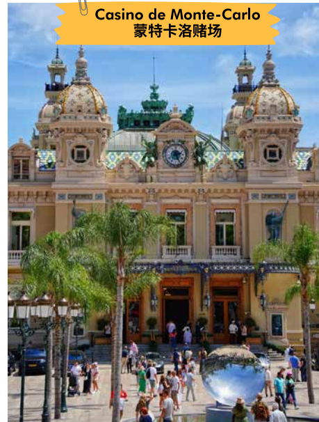
Casino de Monte-Carlo 蒙特卡洛赌场