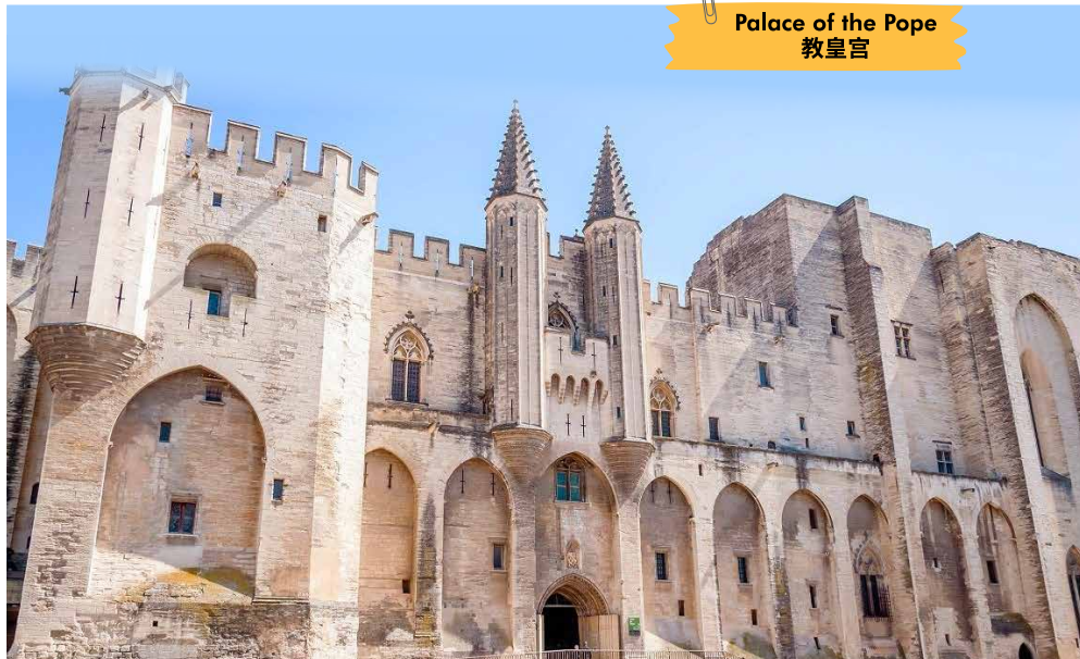
Palace of the Pope 教皇宫