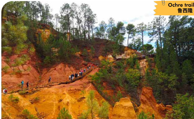
Ochre trail of Roussillon 鲁西隆 - 赭石小巷