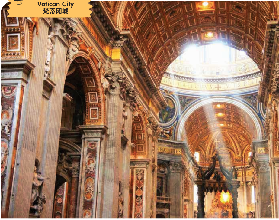
Vatican City 梵蒂冈城